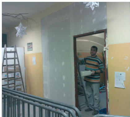
To dzięki A. Ślimakowi SP nr 6 spotkał tak zyciwy gest

Firma "Ista Polska" wspiera Szkołę Podstawową nr 6 w Pyskowicach! Przez trzy dni ponad 30 pracowników firmy brało udział w pracach remontowo-budowlanych we wspomnianej szkole. A wszystko bezinteresownie!