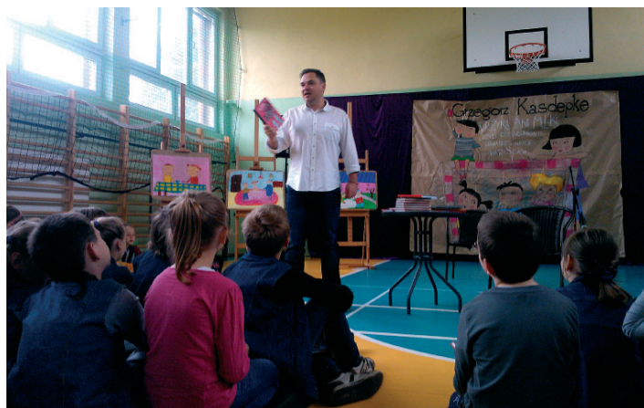
Grzegorz Kasdepke ciekawie opowiadał o swojej twórczości

W Szkole Podstawowej nr 6 w Pyskowicach gościł uznany pisarz książek dla dzieci Grzegorz Kasdepke. Autor czytał fragmenty swoich książek, opowiadał o twórczości pisarskiej, odpowiadał na pytania licznej widowni. - Opowiadania dla najmłodszych zacząłem pisać już jako student dziennikarstwa. Robiłem to dla mojego syna. To on stał się przyczyną tego, że zostałem bajkopisarzem. Twierdzę nawet, że zrobił w ten sposób więcej dla mnie, aniżeli ja dla niego - tłumaczył Kasdepke.