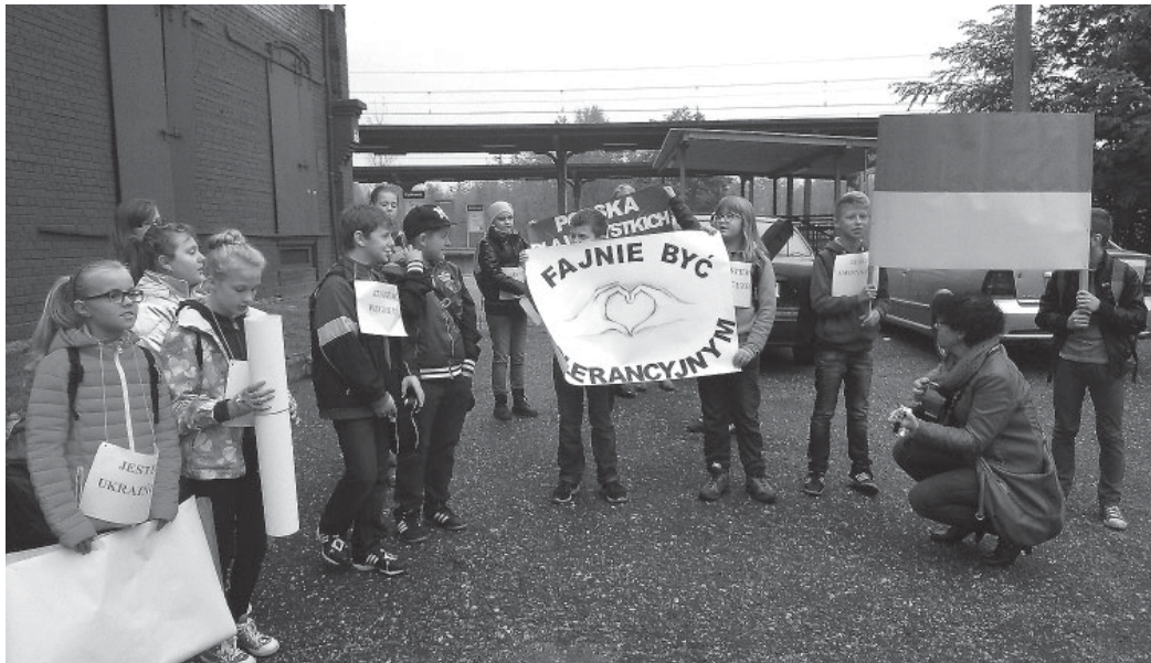
Czekamy na nasz pociąg. I trenujemy śpiew

Podczas zajęć sportowych stosowanych jest wiele metod i form pracy, które podnoszą poziom lekcji i sprawiają, że uczniowie są usatysfakcjonowani po włożonym wysiłku. Wykorzystywana jest mnoga ilość przyrządów - chociażby lina do wspinaczki, odskocznia, skrzynia, kozioł gimnastyczny, drabinka koordynacyjna, siatkarski "bloker" i "radar", rowerki stacjonarne, platformy, a także wyrzutnia do piłek. - Realizujemy również projekt "Nie tylko piłka nożna". Pokazujemy naszym uczniom jak różnorodny jest sport. Zabieramy ich na mecze siatkarskie - chociażby ZAKSY Kędzierzyn Koźle, hokejowe GKS-u Tychy