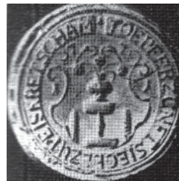
Pieczęć z 1771 roku Garnarzy z Pyskovic

larski i inne, dziś już nie znane. Szereg dokumentów i eksponatów, z których utworzyliśmy ekspozycję, można będzie obejrzeć na wystawie w Muzeum Miejskim do końca kwietnia